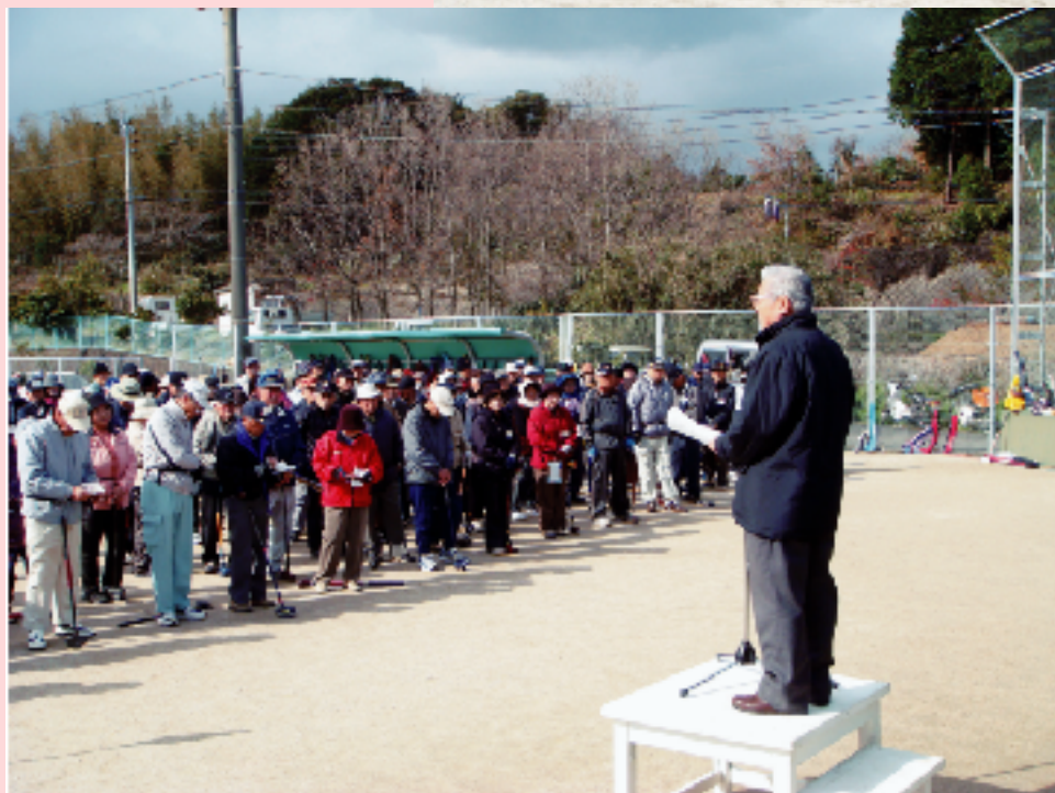
第4回 親善グラウンドゴルフ大会 健康増進と親睦を深める大会となりました。