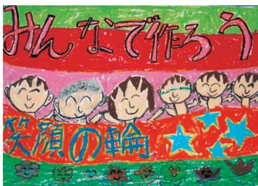
▲西翔生さんの作品