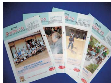
▲社協だより発行事業