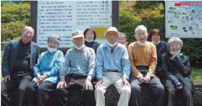
※写真撮影のためマスクを外しております。

編集・発行/社会福祉法人 松浦市社会福祉協議会 松浦市志佐町里免 347 番地 4 TEL (0956) 72-0788 FAX 72-0649 E-mail:matsuura@fukushi-net.or.jp URL:http://www.matsuura-shakyo.com